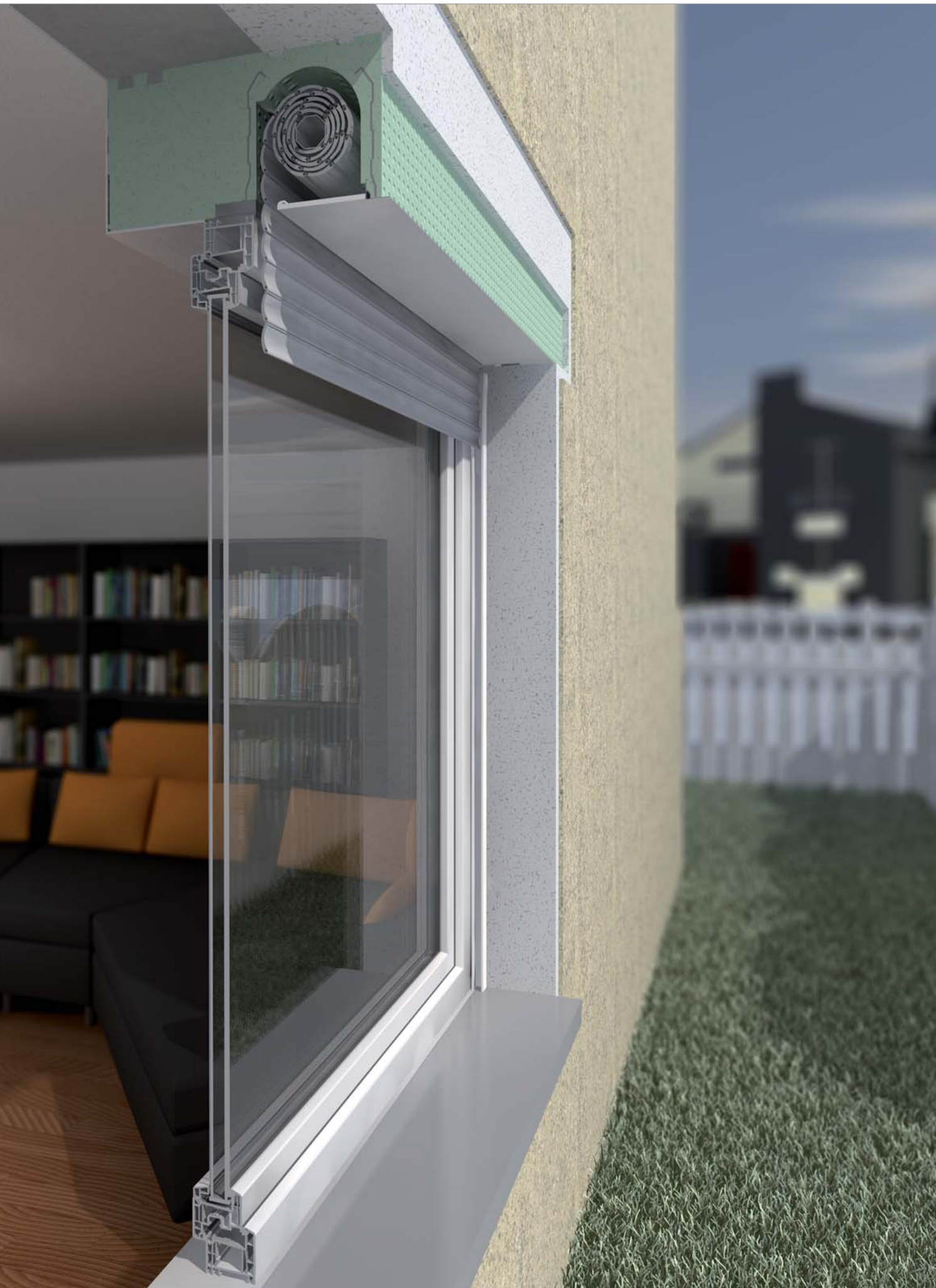
L'immagine mostra ROKA-OUTSIDE con sistema composto di isolamento termico